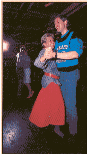
— Till levande musik trädde dansen till sent på natten.

Av Kjell Engström (text)